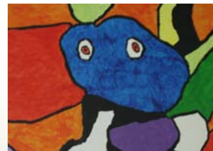
dessin réalisé par un hôte de Peperhof

Là, vous ne rencontrerez pas seulement les cerfs, les lièvres et les faisans, mais aussi des tombes vieilles de plusieurs siècles. Au printemps et en été, les alouettes couvent et chantent. Des oiseaux migrateurs et d'autres animaux annoncent l'automne et l'hiver.